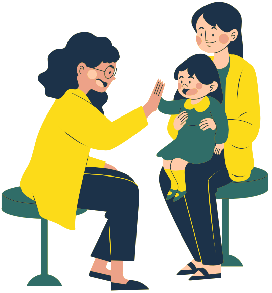
TEAM&CO, avril 2026 - Ne pas jeter sur la voie publique

Plus d'informations sur www.team-and-co.org